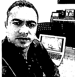
Gustavo Lima nos EUA

O cantor Gustavo Lima se prepara para voltar aos palcos e anuncia a primeira turnê desde o início da pandemia causada pela COVID 19. O retorno do cantor aos shows presenciais será marcado em grande estilo com uma série de shows pelos Estados Unidos que será realizada de 06 a 15 de agosto. A maratona "O EMBADADOR Tour USA 2021" contemplará Orlando e Miami (Flórida), Atlanta (Geórgia), Newark (Nova Jersey) e Boston - capital de Massachusetts, onde o artista apresentará uma edição do Bute-co (festival) já consagrado no Brasil.